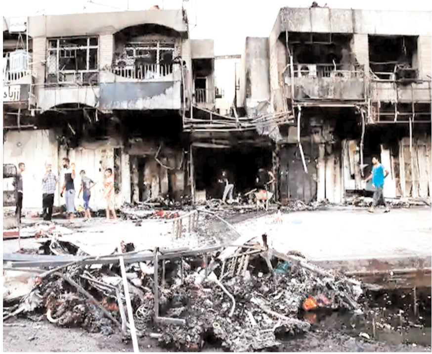
गवाह बन गया था। पुलिस का दावा है कि उक्त आरोपी आतंकी संगठन इंडियन मुजाहिदीन से जुड़े हैं। आरोप था कि इंडियन मुजाहिदीन के आतंकवादियों ने 2002 में हुए गोधरा दंगे का प्रतिशोध लेने के लिए बम धमाके की साजिश रची थी।